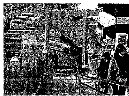
社殿までは わずか 20 段

草津八幡宮は、厳島神社とほぼ同じ頃、1400 年余り前に建てられたもので、西区一帯の総氏神、歴史が最も古いので『元社』ともいわれているとのことです。